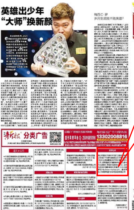
图 3.2-5 第二次报纸公示情况图