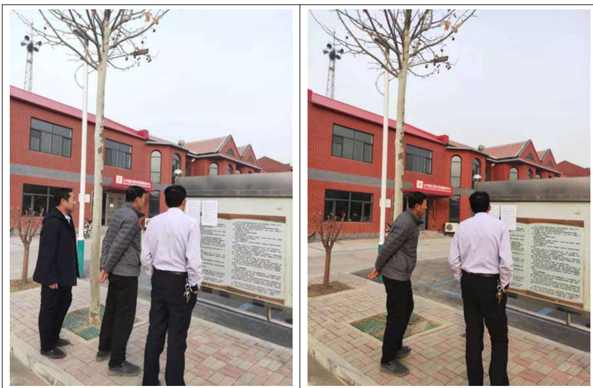
图 3.2-8 张贴公示情况图（红星村）