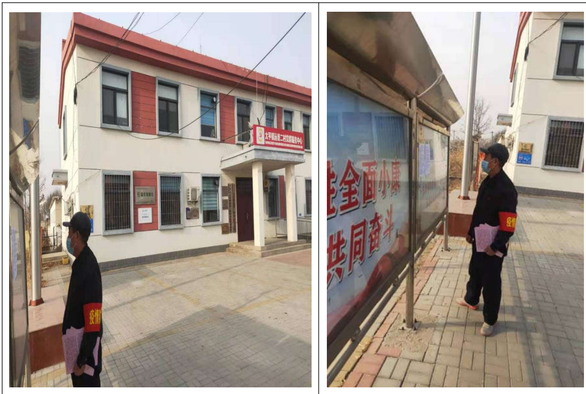
图 3.2-9 张贴公示情况图（远景二村）