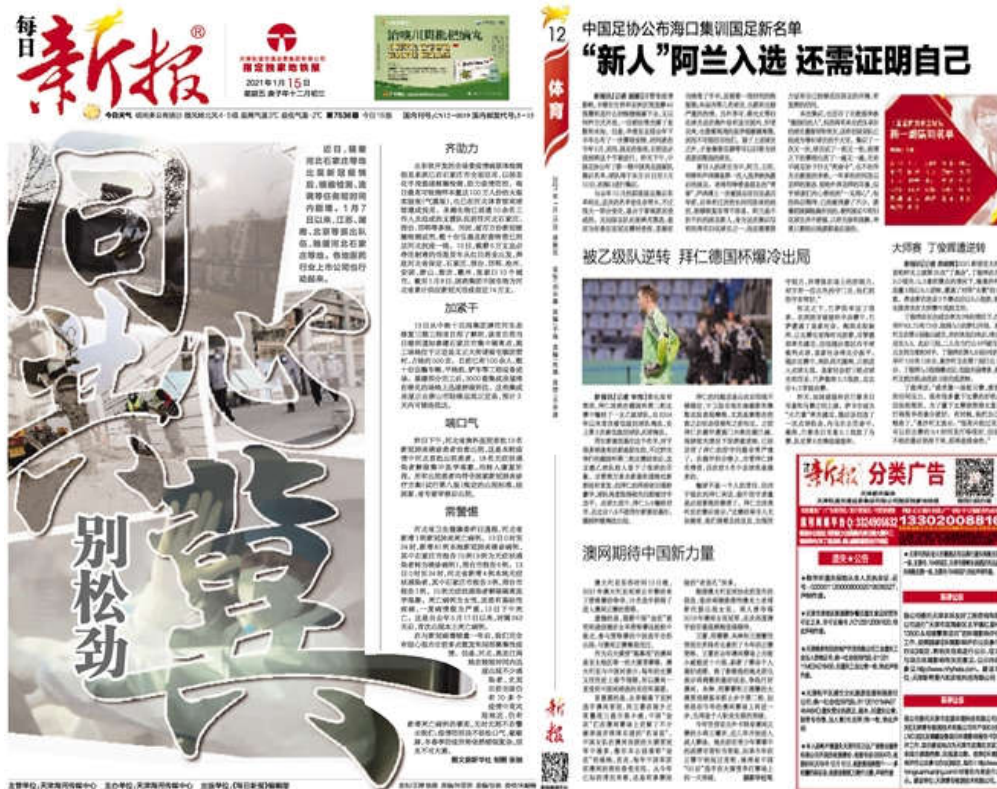
图 3.2-2 第一次报纸公示的版面

报进行 2 次公示，每日新报属于建设项目所在地公众易于接触的报纸，符合《环境影响评价公众参与办法》对建设项目环境影响报告书征求意见稿公示载体的要求。公示截图见图 3.2-2~图 3.2-5。