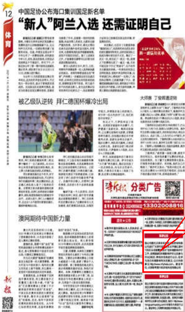
图 3.2-3 第一次报纸公示情况图