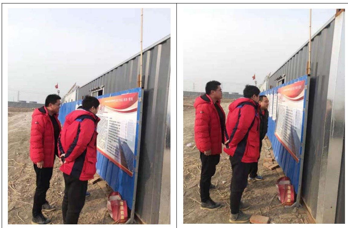
图 3.2-6 张贴公示情况图（建设项目厂址）