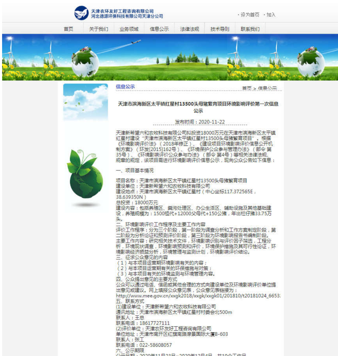
图 2.2-1 第一次网上公示截图