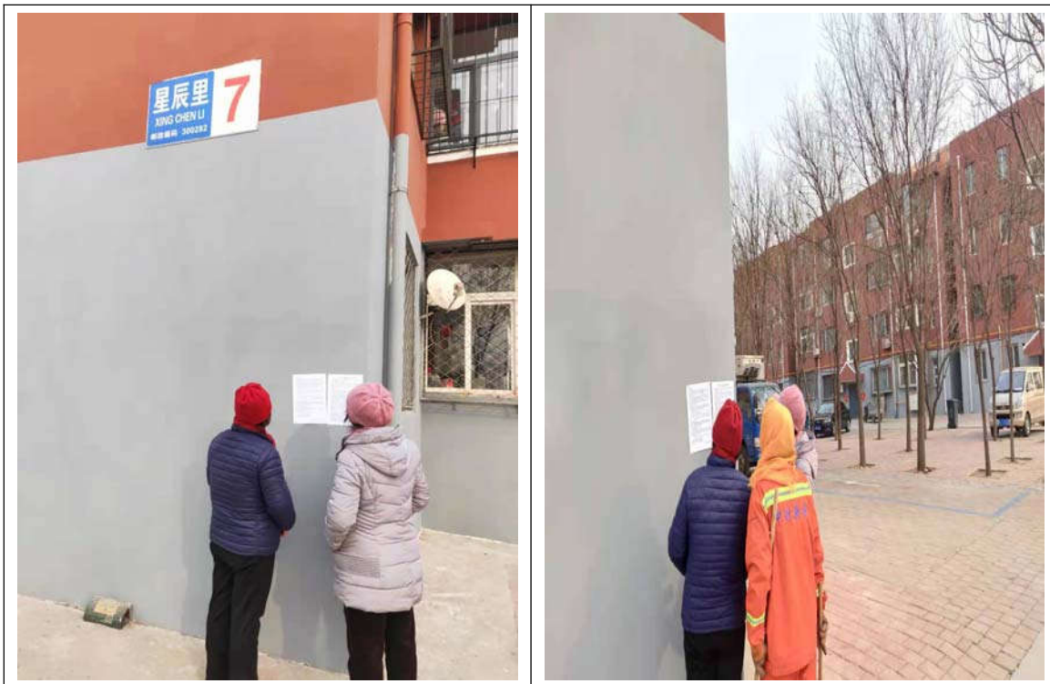
图 3.2-7 张贴公示情况图（星辰里小区）