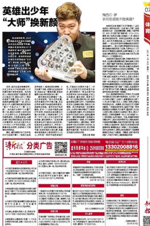
图 3.2-4 第二次报纸公示的版面